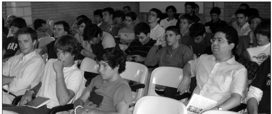
El interés del público se hizo patente en la profundidad de las palabras.

colores oscuros aproximándose a la imitación de la naturaleza tras un intento de recuperación de la filosofía aristotélica. Ésta va a tomar un carácter realista y humano, principalmente en Flandes. Con el paso de los siglos el gran público se inclinó por la importancia del hombre y de ahí va a nacer el Renacimiento, que es reconocido porque utiliza elementos de la cultura clásica. El mayor de sus representantes resultó ser Miguel Ángel especializado en pintar frescos aunque no lo hizo hasta avanzada edad (el primer fresco que realizó fue la Capilla