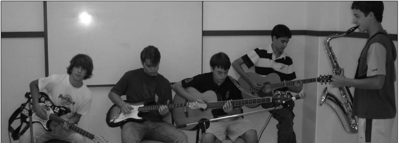
Uno de los dos grupos que componen la actividad de música

Cuando hablamos de música nos referimos al arte de combinar los sonidos con instrumentos musicales para provocar armonía; eso es precisamente lo que están intentando realizar los jóvenes humanistas apuntados a la actividad de música, coordinados por Gustavo Azcona. Cada tarde se reúnen en dos aulas separadas por un tabique (creen que lo clásico y el rock son compatibles, pero no tanto como para ensayar juntos tres horas al día). El objetivo es preparar un concierto que cada año resulta más espectacular para todos los asistentes.