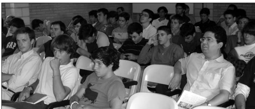
El interés del público se hizo patente en la profundidad de las palabras.

colores oscuros aproximándose a la imitación de la naturaleza tras un intento de recuperación de la filosofía aristotélica. Ésta va a tomar un carácter realista y humano, principalmente en Flandes. Con el paso de los siglos el gran público se inclinó por la importancia del hombre y de ahí va a nacer el Renacimiento, que es reconocido porque utiliza elementos de la cultura clásica. El mayor de sus representantes resultó ser Miguel Ángel especializado en pintar frescos aunque no lo hizo hasta avanzada edad (el primer fresco que realizó fue la Capilla