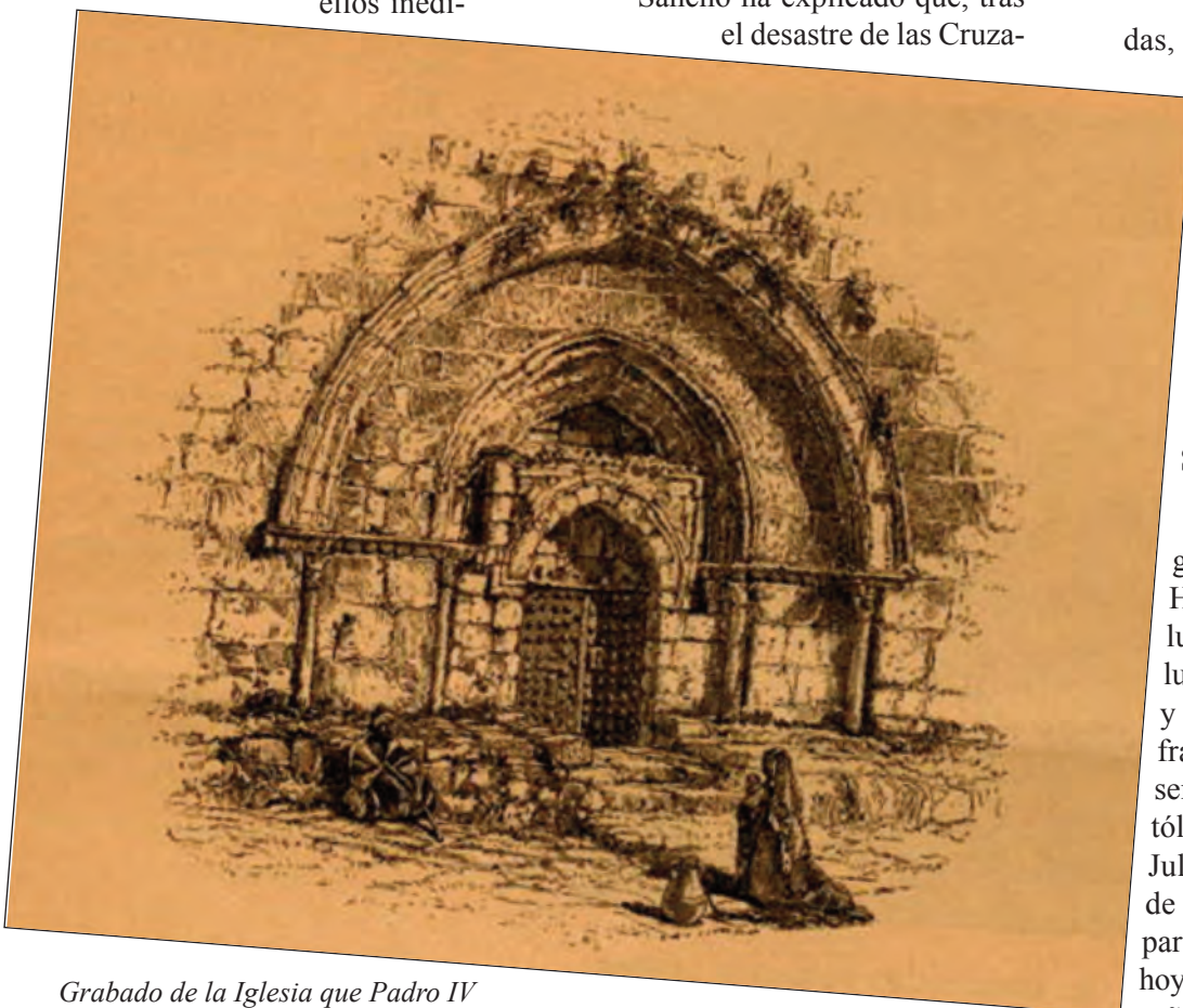
Grabado de la Iglesia que Pedro IV de Aragón hizo construir en Jerusalén

Pedro IV de Aragón consiguió adquirir terrenos en el Huerto de Getsemaní y en el lugar donde se cree que tuvo lugar la dormición de la Virgen y construyó un convento para los franciscanos, que aún se conserva. En 1510 Fernando el Católico de Aragón obtuvo del Papa Julio II la investidura del Reino de Nápoles –Rey de Jerusalén–, para él y sus sucesores, por lo que hoy ostenta ese título el Rey de España.